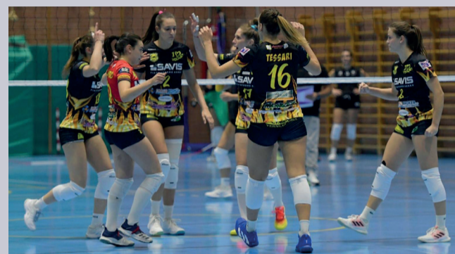
BALZO IN AVANTI La Savis Cargo Broker Volpiano di B1 è ora terza

In campo femminile, nel girone A di serie B1 il Caselle Volley strappa un set in casa della capolista Capo D'Orso Palau: 3-1 (25-14; 19-25; 25-17; 26-24) il punteggio finale del match. Torna al successo, invece, la Savis Cargo Broker Volpiano che va a vincere in casa dell'Igor Volley Trecate per 1-3 (25-19; 19-25; 17-25; 19-25) e balza al terzo posto in classifica, a quota 9, con gli stessi punti della seconda classificata, la Fo.Co.L Legnano, avanti solo per il miglior quoziente set.