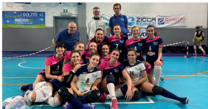
SORRISI DI GIOIA Vittorie per Calton Volley e McDonald's Fortitudo Chivasso

Tra i maschi, riflettori puntati nel girone B di serie C sulla partita tra la Pallavolo Torino Fisiosport e la Polisportiva Ve-