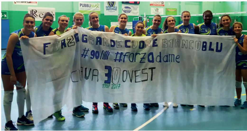
Vittoria piena La Lilliput di B1 concede le briciole alla Pallavolo Capo d'Orso Palau; sotto, il Canavese Volley di B2