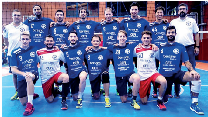
Maratona sottorete L'Alto Canavese Volley supera al tiebreak la Go Old Racconigi

Primi riscontri nel girone A di serie C femminile, con il Venaria Real Volley che all'esordio in campionato alza bandiera bianca sul campo della Mokaor Vercelli: 3-0 (25-12; 25-18; 25-21). Successo al tiebreak per la Pallavolo Montalto Dora, che piega 3-2 (25-22; 23-25; 25-16; 23-25; 15-12) davanti ai propri sostenitori il Volley Villafranca. Sorride l'Allotreb Nixsa Vegoplast, che torna a casa dal match di Aosta contro la Cogne Acciai Speciali con l'intera posta in palio, in virtù del successo maturato con il punteggio di 1-3 (25-16; 21-25; 18-25; 14-25). Nel girone B del massimo campionato piemontese, la Rivarolo Valentino Volpinese si arrende per 3-0 (25-17; 25-14; 25-22) in casa del Playasti. Bene la Pgs La Folgore Carrozzeria Mescia, che sul campo amico di San Mauro Torinese travolge con lo score di 3-0 (25-23; 25-21; 25-12). Non muove la classifica la Balabor Minimold, che a Borgaro Torinese con-