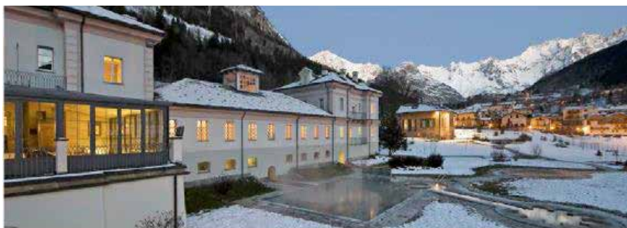
Le Terme di Pré Saint Didier

La bellezza degli scenari, l'autenticità dei luoghi e la ricchezza della proposta turistica fanno di La Thuile una destinazione ideale per ritrovare i propri ritmi, dimenticare le tensioni e star bene, una località in cui sentirsi a proprio agio e potersi ritagliare una vacanza su misura, con la giusta dose di neve, sport, relax e buona tavola.