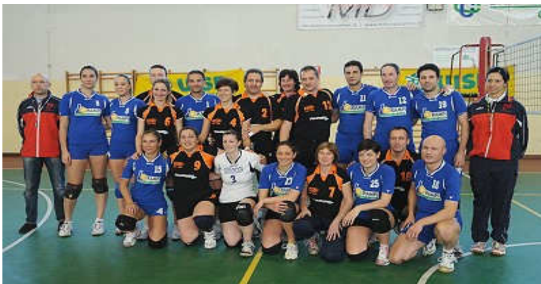
Foto di gruppo per le due finaliste del 4° Torneo di Natale - "Revolution"

Sabato 3 gennaio 2009 si giocano le due Semifinali. I padovani del Kazoo superano con un deciso 3-0 i padroni di casa, oramai "abbonati" a questo scontro, divenuto in pochi anni un vero "tormentone" del Volley Misto di alto profilo. Il compattissimo team di Martellago , di qui in avanti noto come " Muffin Spritz ", con lo stesso netto punteggio batte l'Era Volley Valdobbiadene. Domenica 4 gennaio si conclude il Torneo: alle 9,00 del mattino il derby trevisano di consolazione vede il successo di United Conscio per 2-0; a seguire la finalissima, che dopo la consueta battaglia consegna il 4° Torneo di Natale ai Muffin Spritz Martellago . Un altro 3-0 il risultato finale.