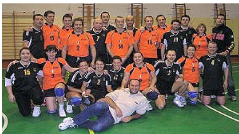
A sinistra, il DJ infiltrato del Torneo in piena azione. Sopra, foto di gruppo per le due squadre finaliste, United Conscio Treviso e Kazoo Volley Padova.