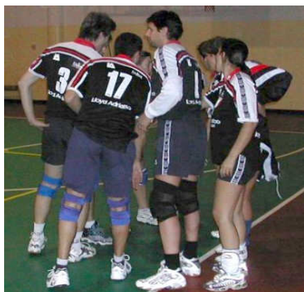
Un timeout dell'AOP Volley Padova durante il primo Torneo "BIG"

... e c'era una squadra, appartenente ad una Società sportiva da poco rifondata, che zitta zitta aveva aggiunto il SECONDO SCUDETTO al proprio palmares. La Società era United Conscio , e lo Scudetto, naturalmente, quello del Volley Misto UISP !!! Dopo il primo titolo, vinto a Fano nel 2000, e la grande delusione dell'anno successivo, in cui lo Scudetto era tornato a Padova, ai grandi rivali dell'AOP Volley, ancora la dolce cittadina delle Marche aveva fatto da cornice al secondo successo assoluto del team che si avviava a diventare, sic et simpliciter ... LEGGENDA !!!