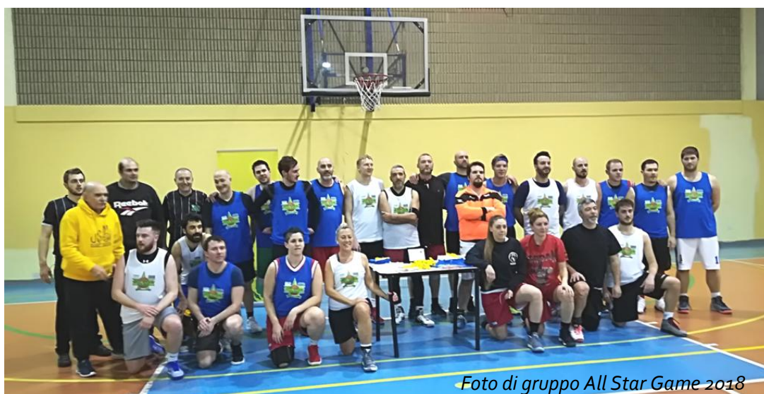
Foto di gruppo All Star Game 2018

Ogni squadra dovrà inviarci anche il nominativo di un giocatore che parteciperà alla gara; il giocatore indicato per la gara del tiro da 3 punti potrà anche essere lo stesso giocatore indicato per l'All Star Game.