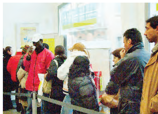
Una foto di repertorio di stranieri nel Cuneese

Ma ieri era anche la seconda giornata senz'auto sotto la Zizola. Al pomeriggio, fino alle 18, il centro cittadino è stato interdetto alle auto. Nella centrale via Cavour anche un gazebo per sensibilizzare sul problema immigrazione. I giovani di «Sinistra Ecologia e Libertà» hanno distribuito volantini per manifestare il loro dissenso sulle recenti affermazioni del ministro Umberto Bossi.