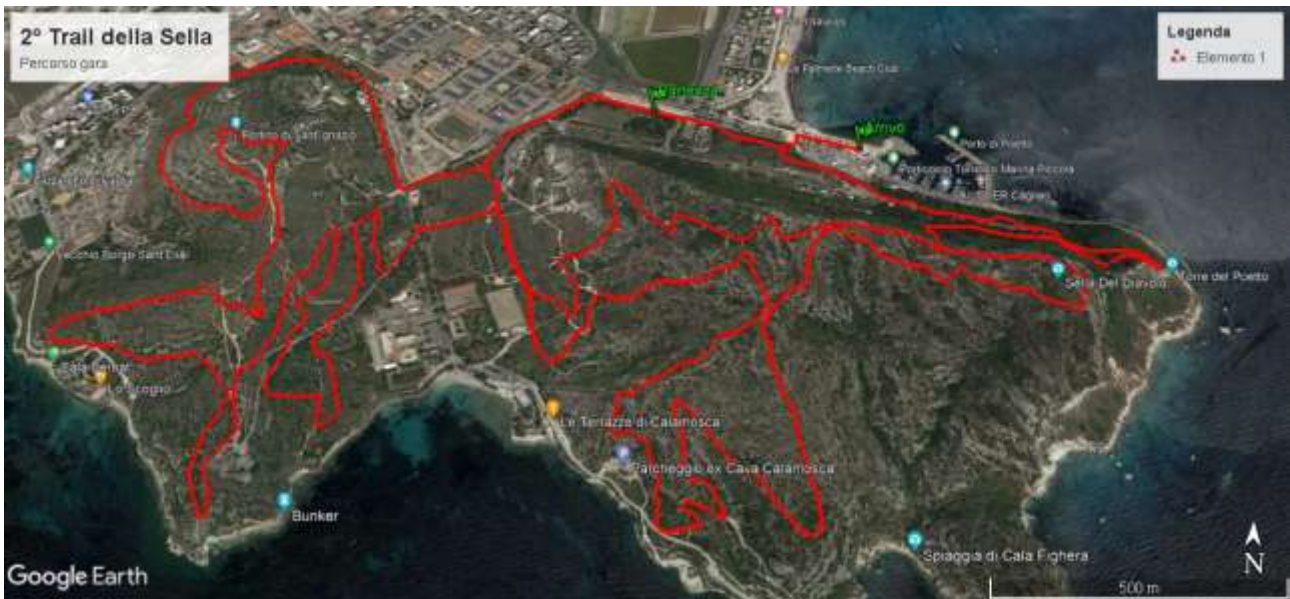
Percorso Trail 22 Km 900D+