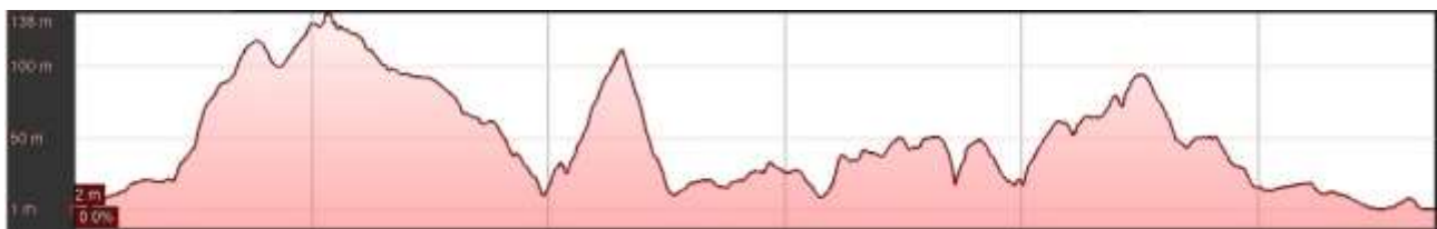
Profilo Altimetrico Short Trail