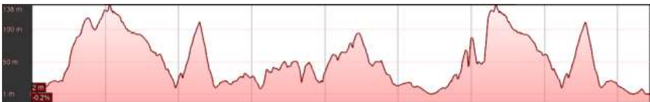
Profilo Altimetrico Trail