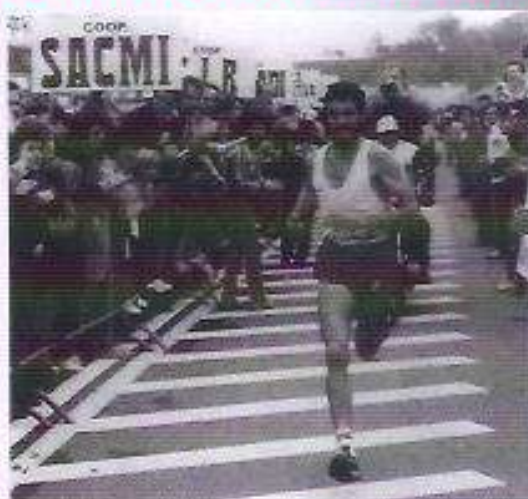
Gelinda Bordin vincitrice nel 1983 in 45'53"