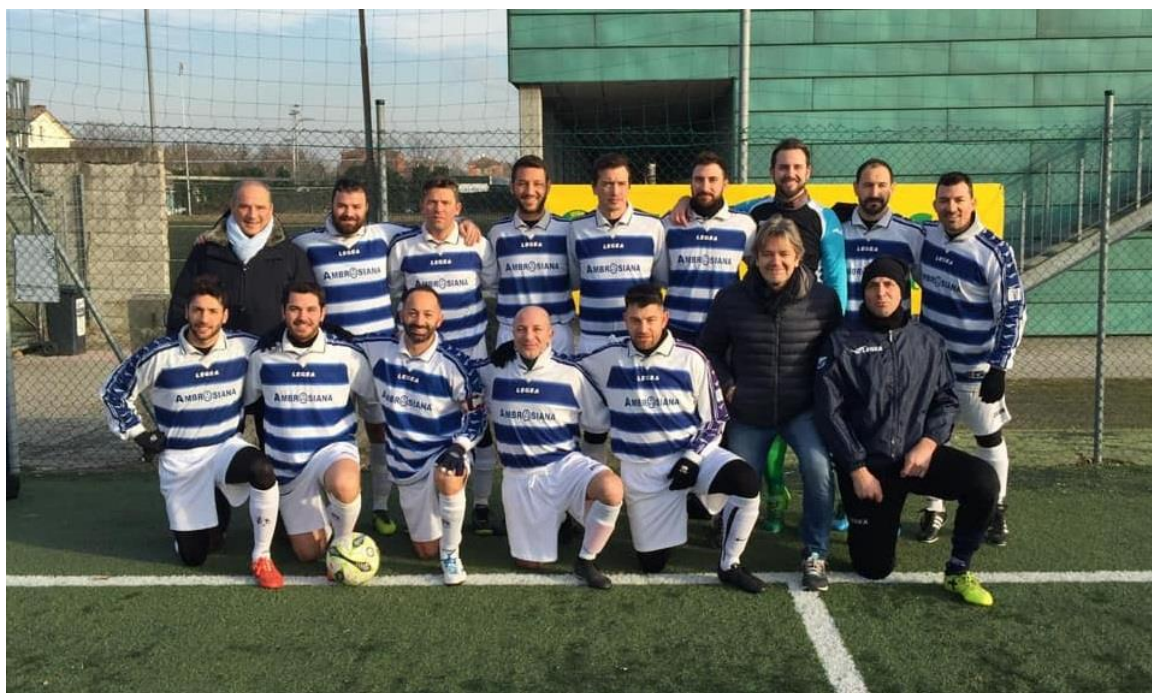
Nella foto 1, la Rappresentativa di Calcio a 11 di Reggio Emilia, attualmente prima in classifica