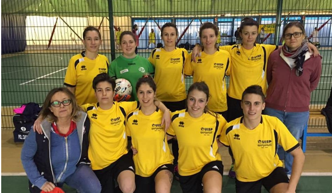
Nella foto 2, la Rappresentativa di Calcio a 5 Femminile di Parma, attualmente prima in classifica