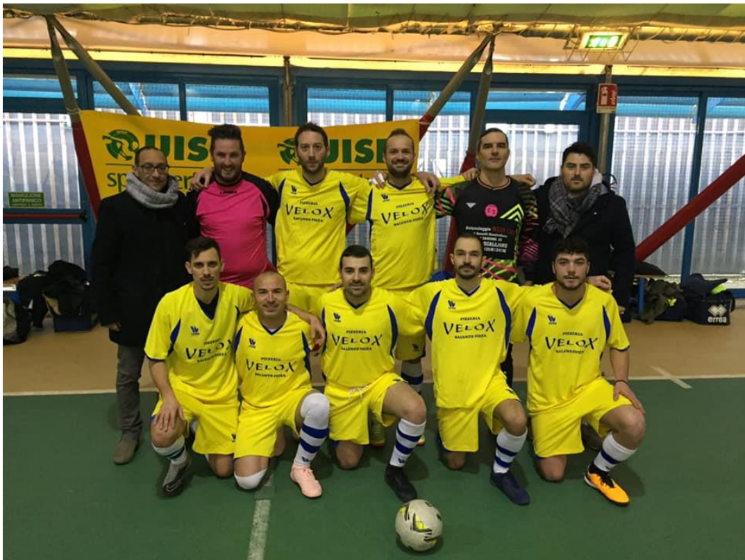
Nella foto 3, la Rappresentativa di Calcio a 5 Maschile di Modena, attualmente prima in classifica