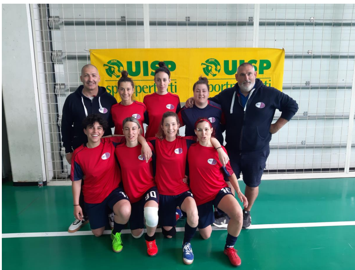
US AcLi San Luca San Giorgio