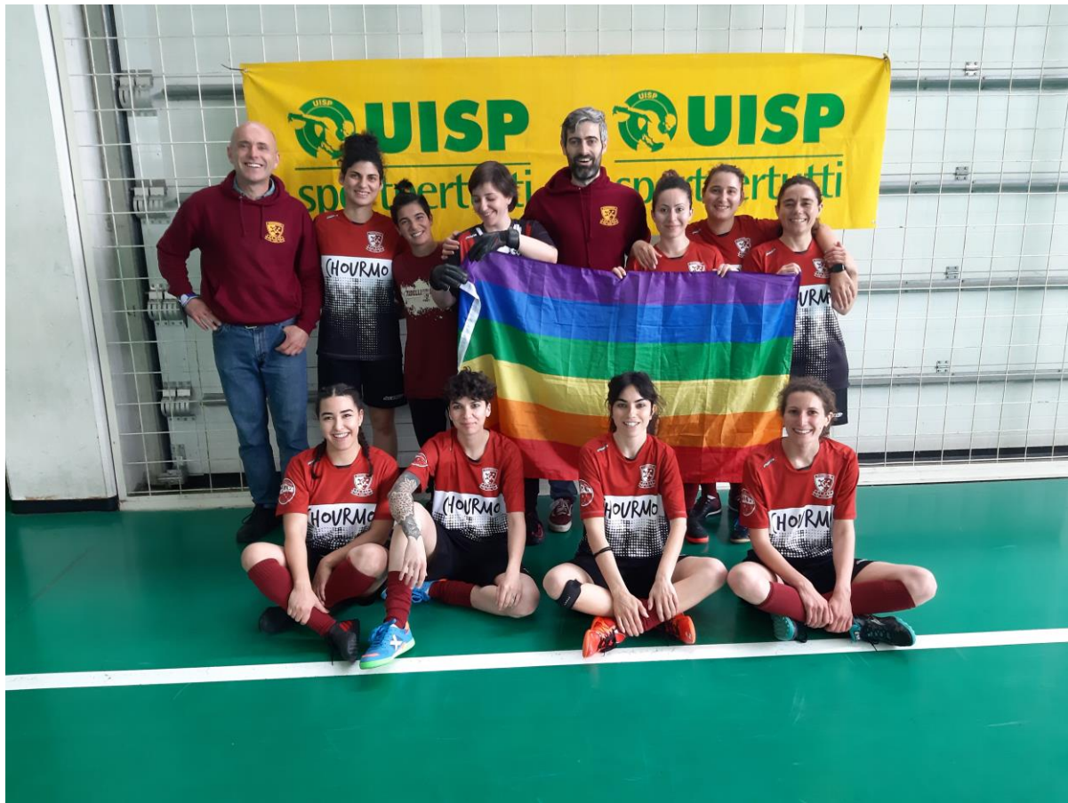
Asd La Paz