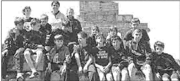
Un precedente raduno d'atletica a Castelnovo Monti

CASTELNOVO MONTI – Importante appuntamento sportivo per giovani atleti quello fissato per oggi e domani, sabato e domenica, 3 e 4 luglio, al Centro di atletica Coni-Fornaciari di Castelnovo Monti. La bella struttura sportiva del capoluogo montano, ospiterà infatti l'Esagonale del Nord, meeting di atletica per rappresentative regionali. Si tratta di un meeting di livello nazionale dedicato alle categorie allievi e junior, a cui hanno aderito, oltre a quella dell'Emilia Romagna, le federazioni di Toscana, Liguria, Friuli, Trentino, Piemonte e Lombardia. Queste regioni schiereranno i loro migliori esponenti per le diverse specialità, e gli atleti partecipanti saranno più di 300 in totale. L'organizzazione come da tradizione è affidata alla società di casa, l'Atletica Castelnovo ne' Monti, in collaborazione con l'Assessorato allo Sport e Promozione del Territorio. Spiegano gli organizzatori: «La gara, oltre ad avere un alto contenuto tecnico, è importante dal punto di vista turistico perché ad essa parteciperanno circa 200 società che avranno modo di conoscere il territorio, con atleti ed accompagnatori che arriveranno sull'appennino reggiano già nel pomeriggio di venerdì, dunque buona parte pernoverà per due notti nelle strutture alberghiere della montagna».