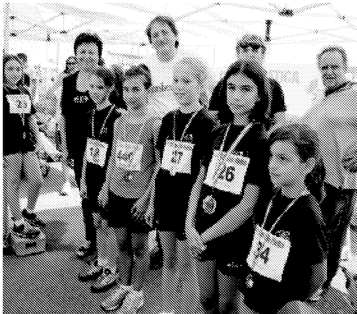
Saranno trecento i giovani atleti che oggi si sfideranno al Centro Coni di atletica di Castelnovo Monti