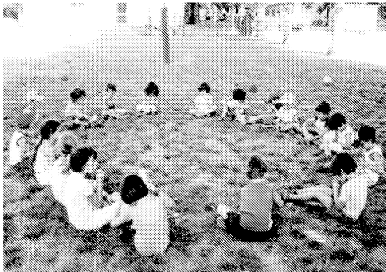
BAMBINI La musica come gioco e il gioco come musica

E PROSEGUE: «È piaciuta molto anche l'iniziativa in cui i bambini dovevano 'dipingere' la musica suonata da un chitarrista, mentre a Castello lo stesso chitarrista ha suonato le musiche scritte dai bambini». Le attività dei centri estivi comunali si concluderanno con uno spettacolo all'Arena nel pomeriggio di giovedì 9 settembre. Intanto prosegue il ricco programma di gite, sport e gioco libero che quest'anno si avvale anche della collaborazione dei Redskins di Imola (baseball).