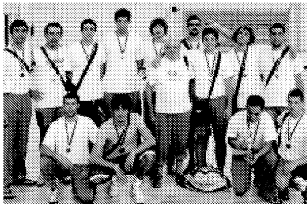
BRONZO La formazione della 'ravennate' Uisp Italia giunta terza ai World Sport Games di Tallin

NELLA bacheca della Uisp restano la medaglia d'oro della pallavolo maschile ai Mondiali juniores 1984 ad Oberwart in Austria, e la medaglia d'argento ai Mondiali juniores nel 1985 a Parigi. Nel beach volley maschile invece la Uisp aveva ottenuto la medaglia d'argento ai World Games nel 2008 a Rimini.