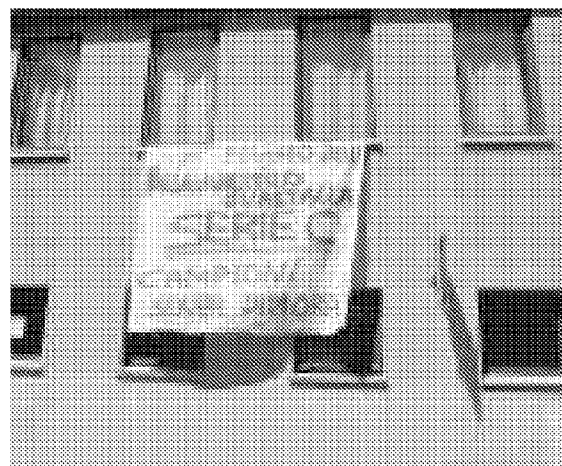
Lo striscione appeso alle finestre della società guastallese