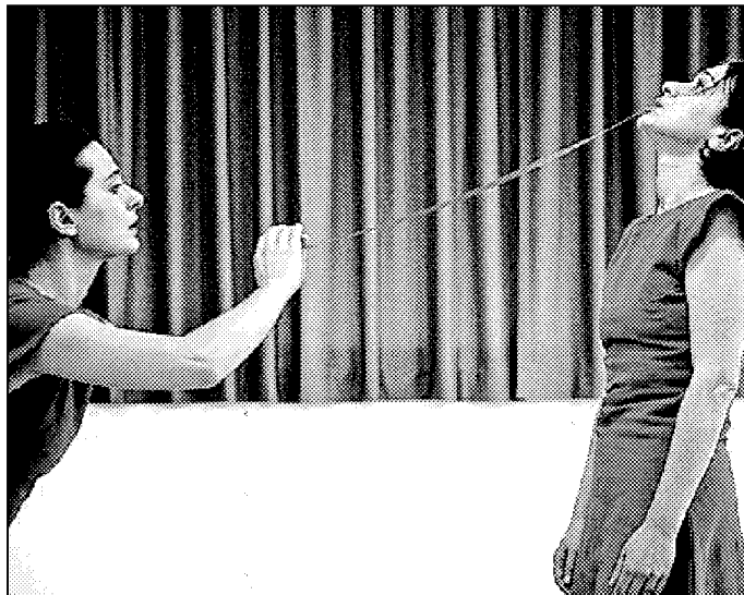
"Filo rosso", esibizione