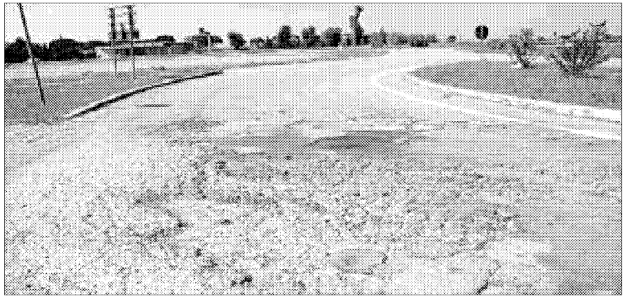
Se questo è asfalto. Eppure siamo sulla via Garibaldi, una delle "entrate" della città