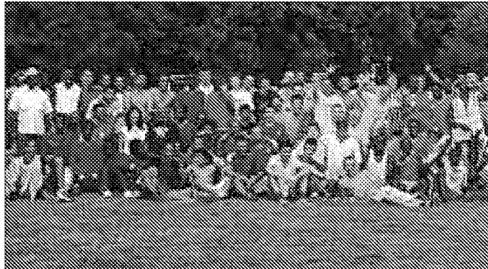
Foto di gruppo per i ragazzi che hanno partecipato al torneo

Quest’anno la manifestazione, che rientrava nella tre giorni di “Mondinpiazza”, è coincisa con la giornata mondiale della diversità culturale promossa da Unesco. Ecco quindi ancora una volta la voglia di divertirsi e ritrovarsi rincorrendo un pallone, e soprattutto il desiderio di gridare forte tutti insieme: “Stop al razzismo e stop ad ogni discriminazione”. Il torneo antirazzista ha interessato direttamente non meno di 200 ragazzi