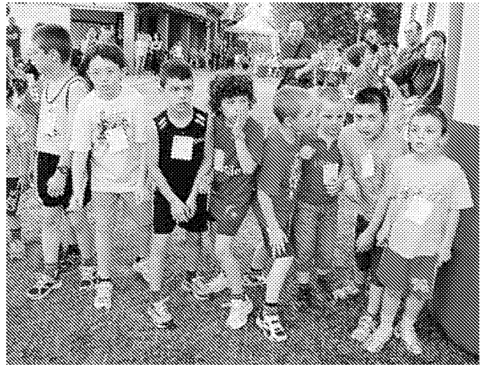
Giovani podisti a Jano