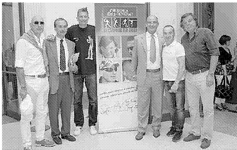
IDOLI Gli ex atleti italiani alla presentazione della tappa bolognese

Nel patto tra «i quattro moschettieri» c'è anche l'istrionico Lucchetta, che dice: «Noi campioni non stiamo sul piedistallo, ma vogliamo dare l'impulso ai bambini per avere benessere personale e salute fisica. Loro sono come delle spugne e recepiscono i nostri stimoli. Non c'è nulla di agonistico, è un divertimento totale».