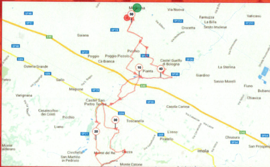
GRAN FONDO di MEDICINA - Mtb lunghezza: 50 km