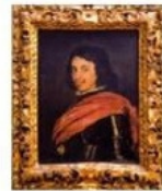
Aceto Balsamico del Duca di Adriano Gesseli s.r.l.