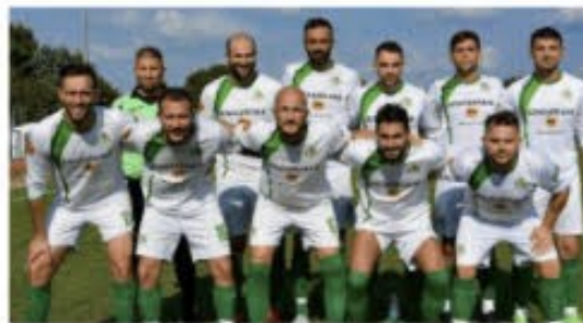
Il Real Villasanta non ha ancora perso una partita nel campionato Uisp

L'unico posticcio riguarda Gentlemen Monza-Excelsior: è in programma sabato pomeriggio