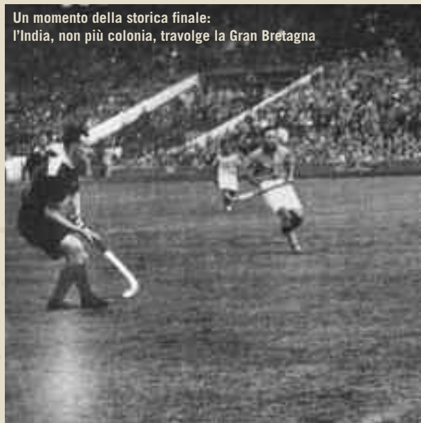
Un momento della storica finale: l'India, non più colonia, travolge la Gran Bretagna