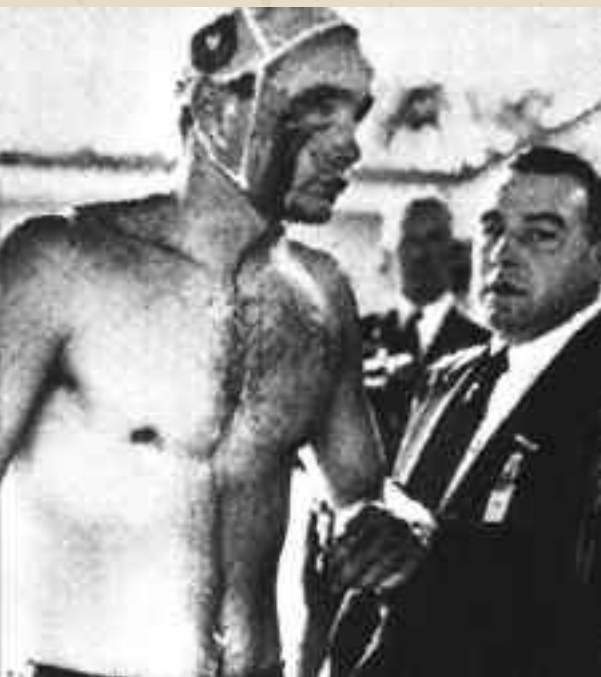
URSS-Ungheria finì con una incredibile rissa