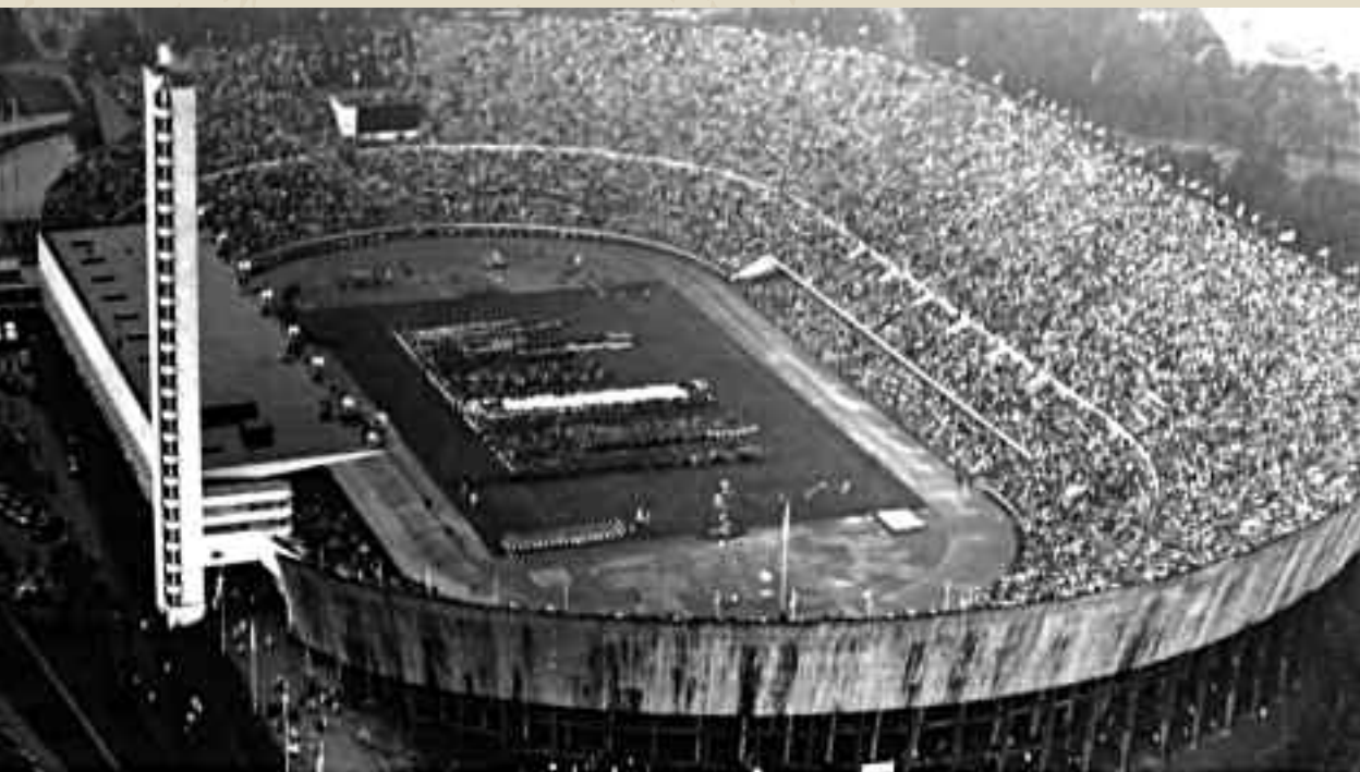
Lo stadio Olimpico di Helsinki pieno di folla nel 1952

inizialmente adottato una politica "più stalinista di Stalin", il governo di Belgrado rivendicava un'autonomia che finì ben presto per irritare Mosca al punto che, nel 1948, si arrivò ad un'irreparabile rottura politica. Tito venne accusato di "revisionismo" e la Jugoslavia, allontanata dalla "famiglia comunista", fu costretta per sopravvivere ad aprirsi verso occidente. Almeno fino alla metà degli anni '50 lo "scisma" fra Tito e Stalin provocò una rottura nelle relazioni fra i due paesi; ecco perché quando URSS e Jugoslavia