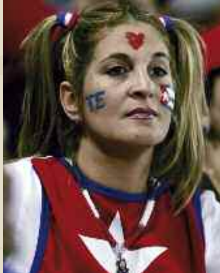
A Cuba il baseball è davvero lo sport nazionale

Dal 2012 il baseball non fa più parte del programma olimpico, ma i giapponesi hanno chiesto al Cio di poter far tornare questa disciplina nel contesto dei Giochi in occasione dell'edizione 2020. In Giappone, lo sport del "batti e corri" è popolarissimo.