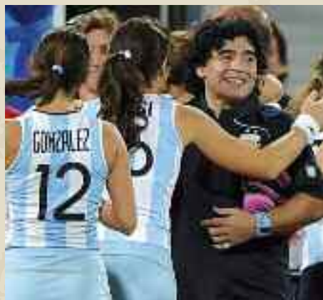
Anche Diego Maradona è un tifoso delle "Leonas"