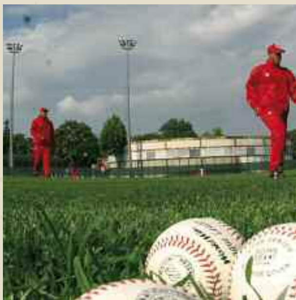
La nazionale cubana si è allenata più volte a Roma

La più celebre alle Olimpiadi si svolse ad Atlanta, nel 1996, in casa statunitense. Si