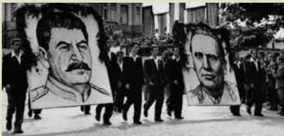
I ritratti di Stalin (a sinistra) e Tito, il leader sovietico e quello jugoslavo, in una cerimonia nel 1950