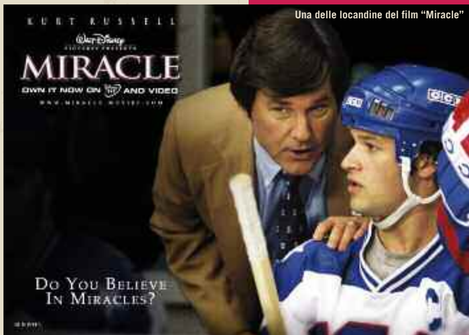
Una delle locandine del film "Miracle"

cevano Urss, "a meno che il ghiaccio non si sciogla" scrivevano i giornali. Prima dei Giochi, la nazionale di Brooks era stata strapazzata da un club russo, l'Armata Rossa, e i sovietici collezionarono successi nettissimi prima della resa dei conti. Erano gli anni della Guerra fredda, dei boicottaggi, nell'estate gli americani non sarebbero andati a Mosca a gareggiare nell'olimpiade estiva, quattro anni dopo i sovietici avrebbero "restituito" il favore rinunciando al viaggio a Los Angeles. E invece grazie al gol decisivo di Eruzione e alle parate di Jim Craig, le cose si misero in modo del tutto impreveduto. Al Michaels, il telecronista dell'Abc, commentò l'accaduto in questo modo: "Credete ai miracoli? Eccone uno". L'Urss veniva da quattro medaglie d'oro di fila nelle precedenti edizioni e la squadra americana era senza i professionisti della NHL (che sbarcarono ai Giochi solo 12 anni più tardi). A proposito di professionisti, c'è una storia da raccontare. Torniamo a Mike Eruzione: aveva 25 anni, una vita davanti, soldi da guadagnare con