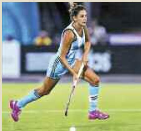
Luciana Aymar è il mito dell'hockey prato argentino

volano in finale. Che perderanno contro l'Olanda. Ma l'onore dell'hockey argentino è salvo. Quanto alle Falkland-Malvinas sono sempre là, in cerca di una soluzione sempre faticosa.