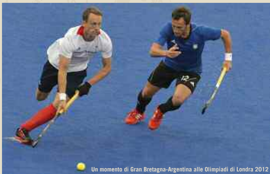
Un momento di Gran Bretagna-Argentina alle Olimpiadi di Londra 2012

nelle successive settimane. Va nelle isole contese e gira uno spot, che si conclude con queste parole: "Per gareggiare sul suolo inglese, ci alleniamo sul suolo argentino". Non l'avesse mai detto: il governo britannico chiede alla televisione di Buenos Aires di ritirare lo spot, ma la presidente Cristina Kirchner rifiuta, interviene pure