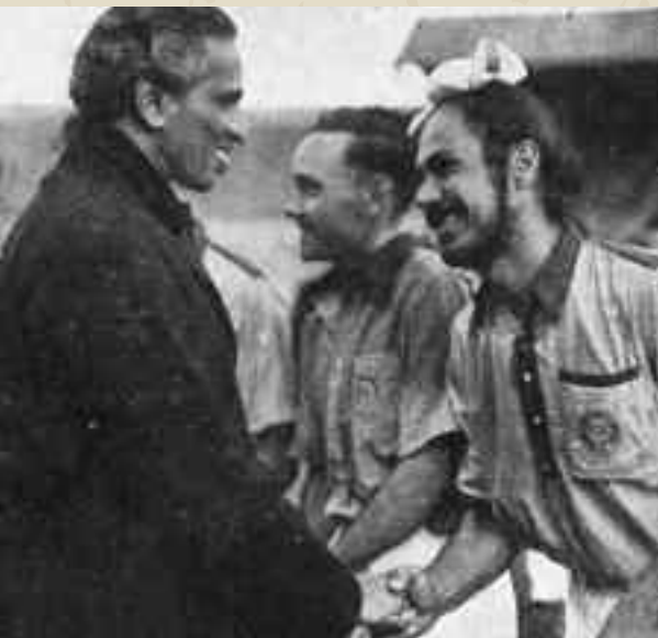
Gli indiani dell'hockey olimpionici anche nel 1948

la finale fra India e Gran Bretagna. Wembley per una volta non è calcio, è hockey: sulle tribune 25mila spettatori, gli indiani sono tanti sugli spalti. Prima della partita, c'è la sfida delle previsioni del tempo: gli inglesi, spesso giocatori venuti dal cricket o dal rugby, sperano nella pioggia; gli indiani, alcuni giocano anche a piedi scalzi, hanno bisogno del sole. Scoppia un caso: la decisione degli organizzatori di far giocare la finale per il terzo posto (fra Pakistan e Olanda) nello stesso giorno e sullo stesso terreno della sfida per la medaglia d'oro, fa infuriare gli indiani: “Sanno che siamo più forti, vogliono un campo pieno di fango per impedirci di giocare”. Ma non c'è partita: gli indiani vincono,