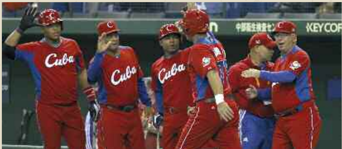
Cuba ha vinto 3 volte la medaglia d'oro olimpica nel baseball

C uba e Stati Uniti sono vicini di casa. Ma per decenni non si sono parlati. Dopo la rivoluzione cubana del 1959, i rapporti si sono presto deteriorati fino alla rottura delle relazioni diplomatiche e soltanto di recente si sta vivendo un'epoca di disgelo. La "Guerra fredda" si è alimentata anche di sport, di uno in particolare: baseball o Beisbol, come si dice a Cuba. Si è combattuto sui diamanti di tutto il mondo, in particolare in quello olimpico, ma anche nel corteggiare i migliori talenti dell'isola per tentare di strapparli alla "pelota rivoluzionaria". "Dai, venite a giocare da noi, diventerete ricchi". "Macché, per noi conta più l'orgoglio del denaro". Il botta e risposta è andato avanti per decenni. Intanto proseguivano le sfide.