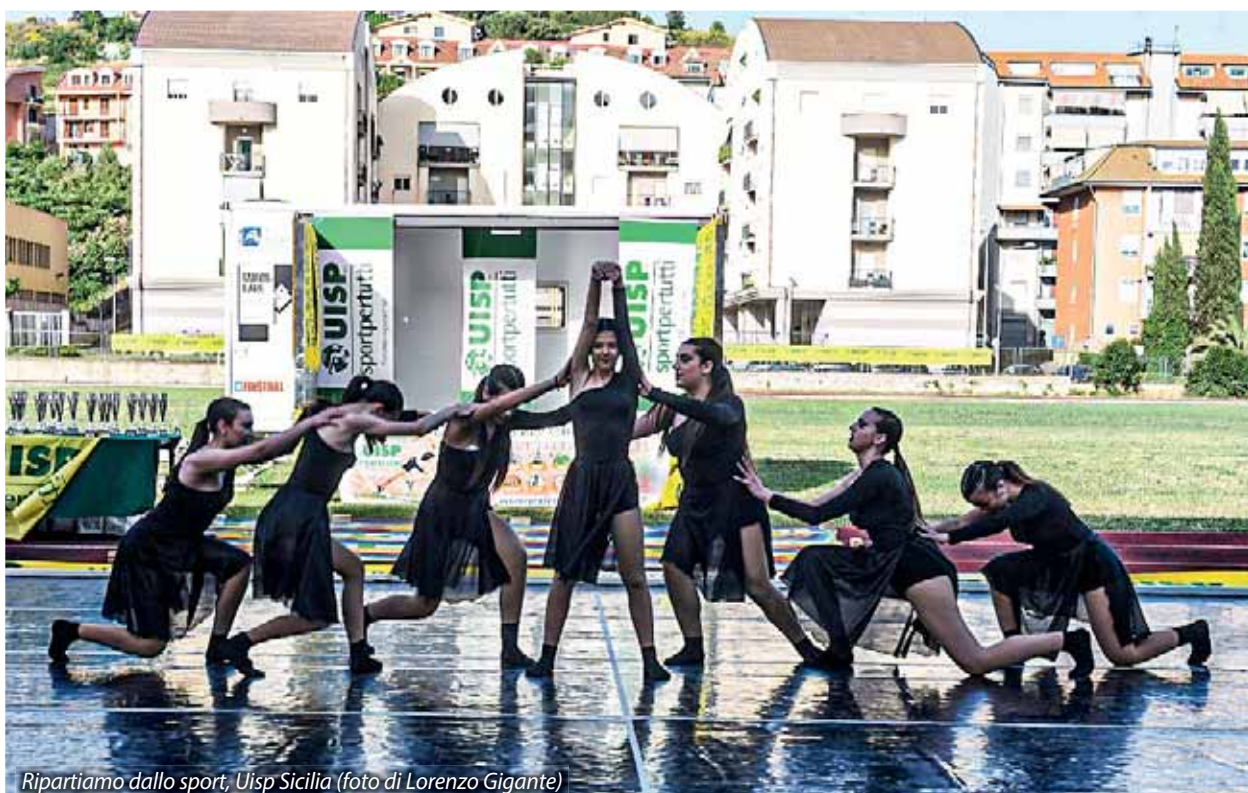
Ripartiamo dallo sport, Uisp Sicilia