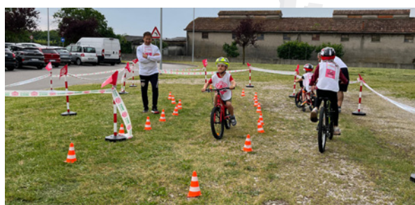
Comitato di Treviso