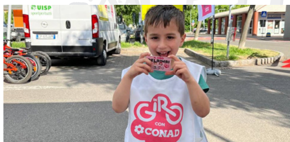
Comitato di Modena