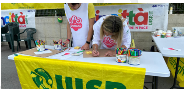
Comitato di Siena