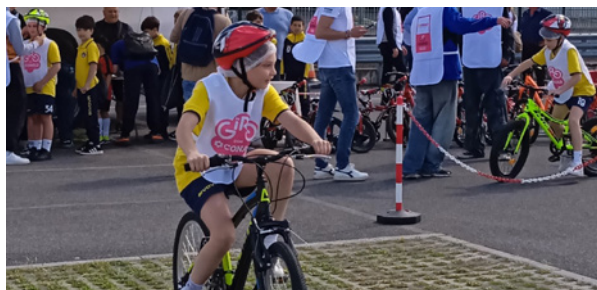
Comitato di Napoli