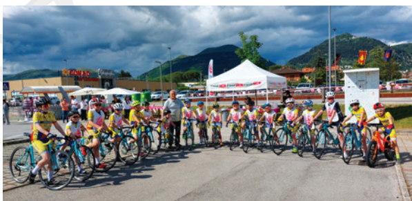
Comitato di Lucca