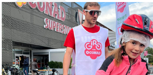
Comitato di Padova