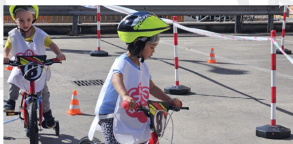
Comitato di Roma