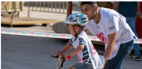
Comitato di Bari

Il Giro dei Bimbi, l'iniziativa promossa da Conad con la partnership sportiva di Uisp nazionale si è svolto lungo il percorso del Giro d'Italia.