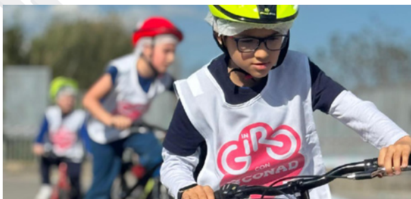
Comitato di Potenza