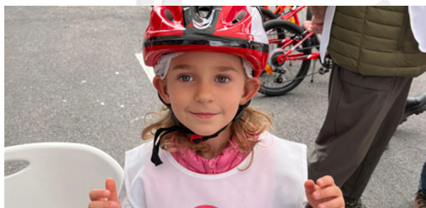
Comitato di Pordenone