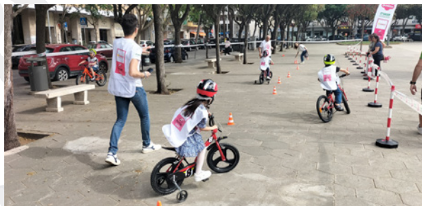
Comitato di Lecce