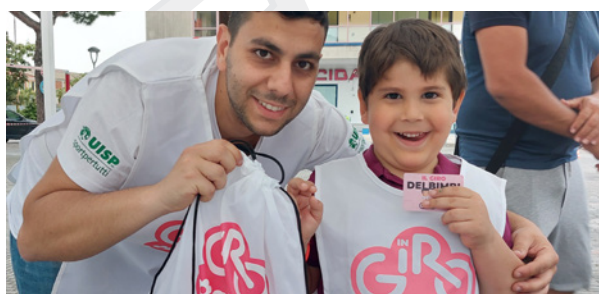
Comitato di Teramo