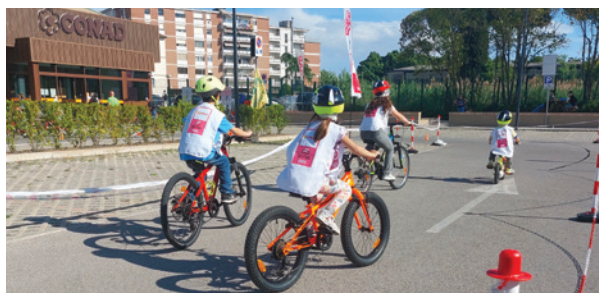
Comitato di Pisa

Durante tutto il mese di maggio 2025 si sono tenuti una serie di appuntamenti in 25 città, in collaborazione con 21 Comitati Uisp.