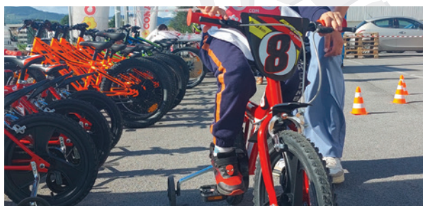
Comitato di Perugia