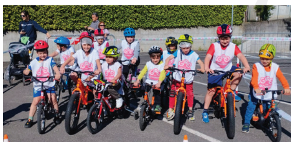
Comitato di Reggio Emilia