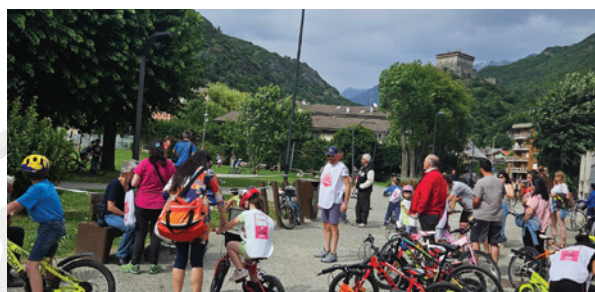
Comitato Valle d'Aosta