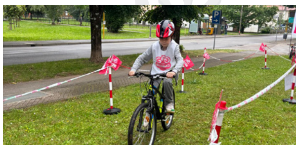
Comitato di Gorizia