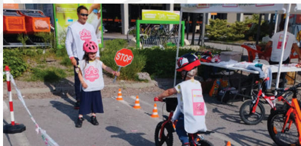
Comitato di Trento