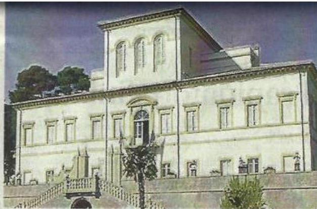
Sotto, la conferenza stampa di presentazione di Agrishow. Sopra, Villa Caprile. A destra uno spettacolo dei Benandanti