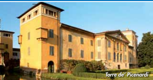
Torre de' Picenardi