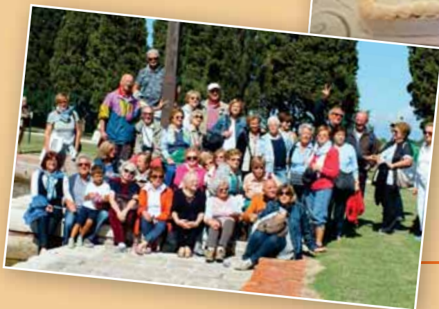
Venezia - Isole della Spiritualità 8 settembre 2015