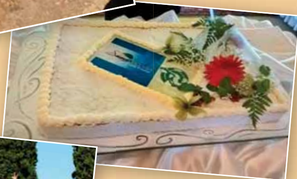
Montichiari - Pranzo sociale 21 ottobre 2015