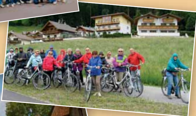
Bicicletta San Candido - Lienz 20 Giugno 2015