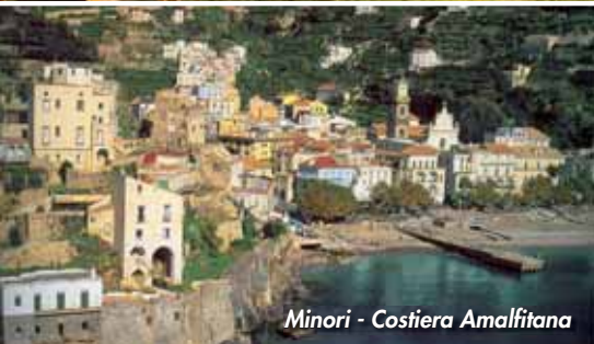
Minori - Costiera Amalfitana