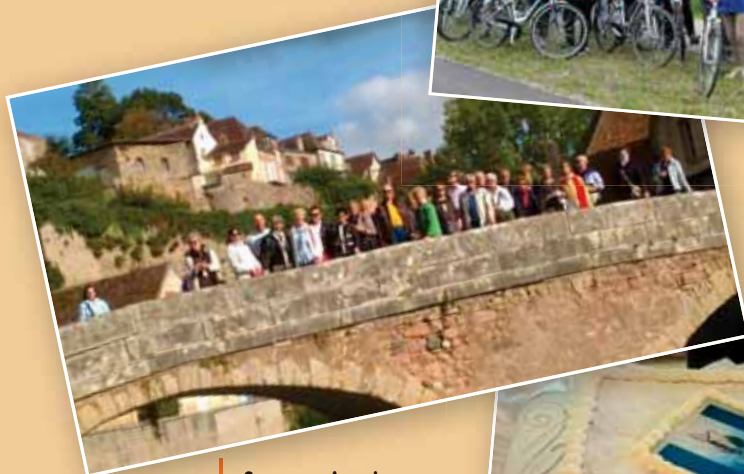
Semur en Auxois Settembre 2015