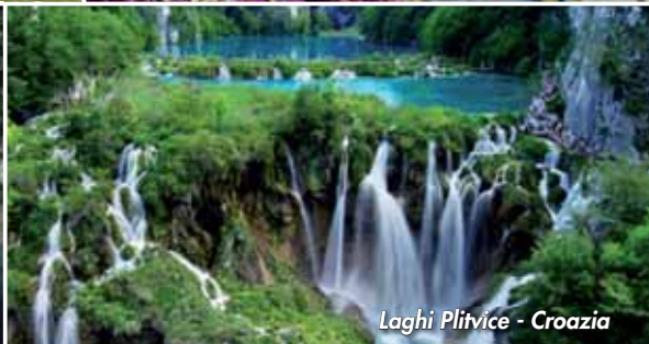
Laghi Plivice - Croazia