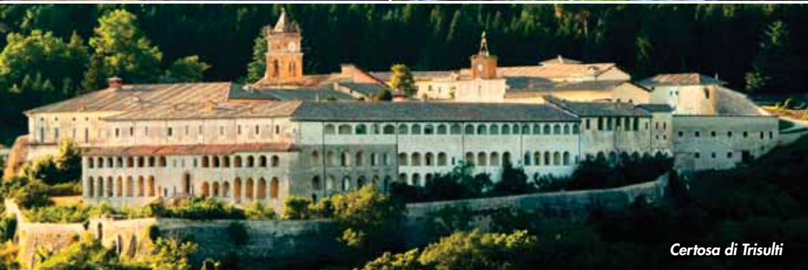
Certosa di Trisulti