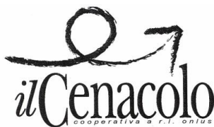
Coop. Sociale O.N.L.U.S. Consoziata CO&SO