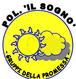
Polisportiva Il Sogno