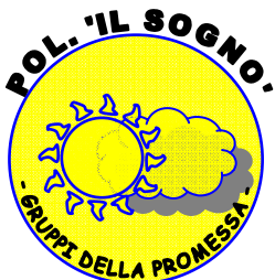
Polisportiva Il Sogno