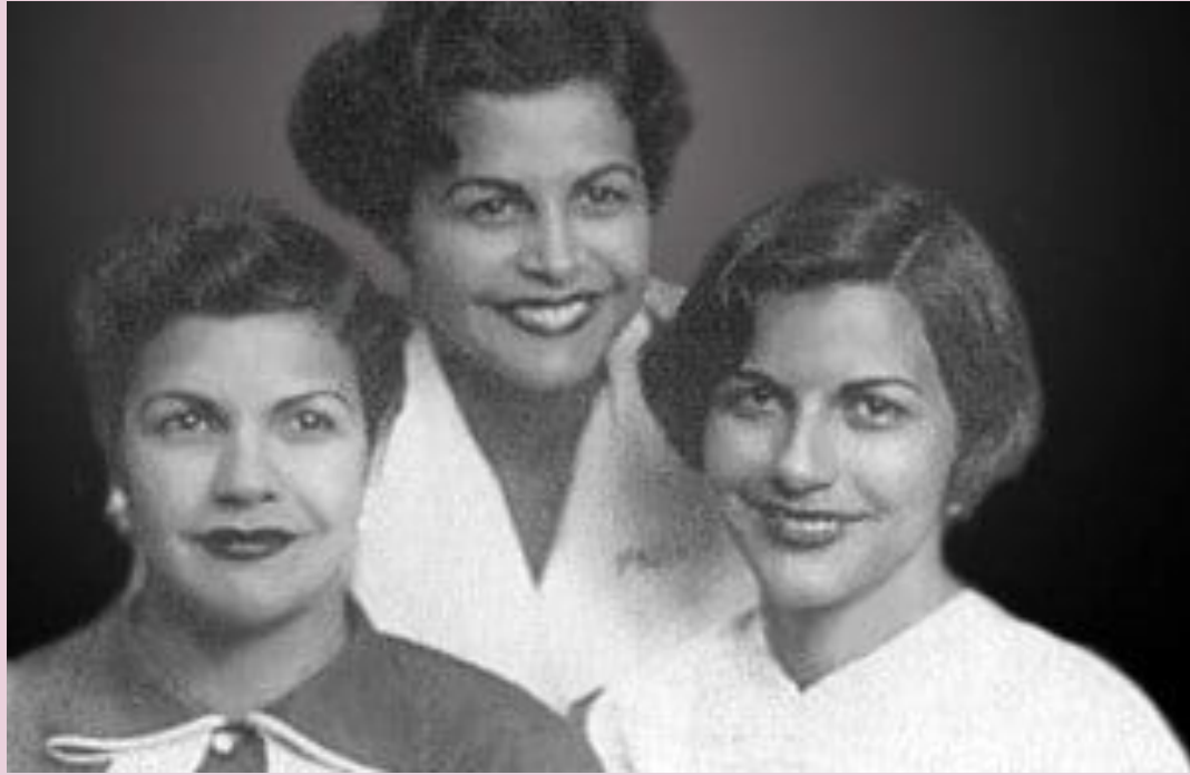
Le sorelle Mirabal