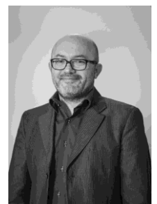
IL PRESIDENTE AZIO MINARDI

Da sottolineare infine il ruolo di primo piano svolto dal Comitato di Reggio Emilia nella rete associativa Uisp, concretizzatosi nell'impegno diretto della struttura in progetti e attività di livello nazionale che hanno avuto ricadute positive in ambito locale e hanno valorizzato lo staff di dipendenti e collaboratori del Comitato stesso, confermandone il tasso di reputazione e affidabilità.