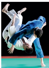
Una foto d'archivio di promozione di Judo