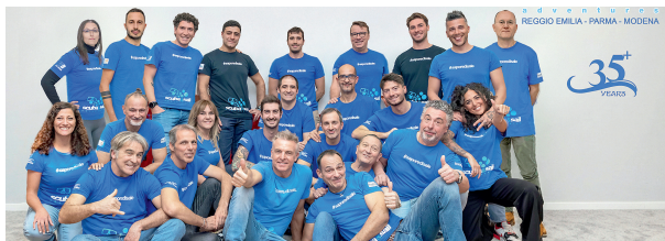
REGGIO EMILIA - PARMA - MODENA 35 ANNI