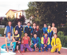
Una foto di gruppo dello staff di Scuba & Sail Adventures