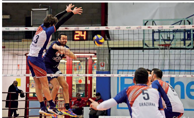
Successo interno Il Sant'Anna San Mauro conquista l'intera posta in palio

Il Sant'Anna San Mauro supera 3-1 la Negrini Gioielli Acqui Terme e conquista così il suo decimo punto del 2018 in quattro gare e tiene il passo delle concorrenti, restando in scia a Pivielle e Cuneo e con una Pallavolo Saronno che non pare più così brillante come un mese fa.