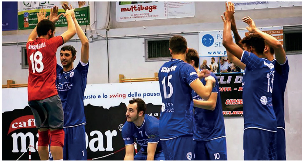
L'ingresso in campo La Pivielle Cerealterra ha regalato una grandissima soddisfazione a tutti i suoi sostenitori

Niente da fare nel girone A di serie B2 femminile per l'ABi Logistics Canavese Volley, opposto sul campo amico alla corazzata Futura Volley Giovanni Busto Arsizio. Netto il successo della prima della classe ad Ivrea con lo score di 0-3 (17-25; 20-25; 19-25), ma non sono queste le partite in cui le ragazze di Colombo devono andare a caccia di punti salvezza. Basti pensare che sinora la Futura Volley Giovanni ha conquistato 13 vittorie, incamerando una sola sconfitta, per di più al tiebreak. La contemporanea vittoria a sorpresa dell'Unet E-Work Busto Arsizio in casa del Pavic Romagnano complica i piani del Canavese Volley, ora con soli tre punti di vantaggio proprio sulla compagine lombarda, quart'ultima e invischiata nella zona retrocessione. Sabato 10 febbraio, in casa del fanalino di coda Lilliput Settimo, Bona e compagne dovranno conquistare l'intera posta in palio per mettere fieno in cascina e allontanarsi nuovamente dalla compagine targata Unet E-Work. Il girone di ritorno della Finimpianti Rivarolo Volley inizia con uno stop esterno per 3-1 (25-14; 18-25; 25-17; 25-13) sul campo della Prochimica Virtus Biella. Le biancorosse canavesane, dopo aver ceduto nettamente la prima frazione di gioco alle forti avversarie, riescono con