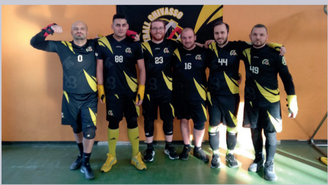
PROVA OPACA I Dracarys sconfitti in casa dagli Hit Bulls