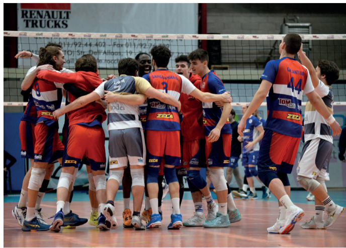
IN FESTA I giocatori del Sant'Anna Tomcar dopo la vittoria con la PVL

In serie C femminile, A.F. Volley corsaro nel girone A sul campo dell'El Gall per 0-3 (20-25; 13-25; 19-25). Sconfitta interna in 4 set (14-25; 25-21; 31-33; 20-25) per la Pallavolo Montalto Dora contro l'In