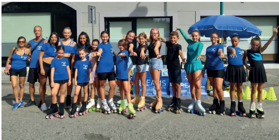
CON IL SORRISO Gli atleti e i tecnici dello Skating Dreams alla prima edizione di Sportkultur