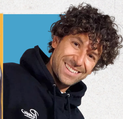
PENNA Popping Hip Hop