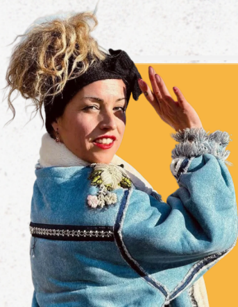
DENICHIC Locking Hip Hop