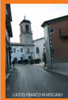
CASTELFRANCO IN MISCANO