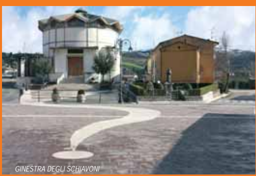
GINESTRA DEGLI SCHIAVONI